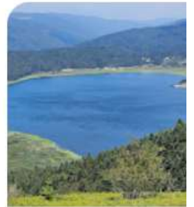
Abant Gölü Milli Parkı