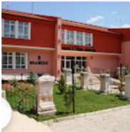
Bolu Kültür ve Turizm İl Müdürlüğü