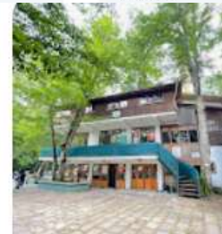
Hayreddin-i Tokad Türbesi