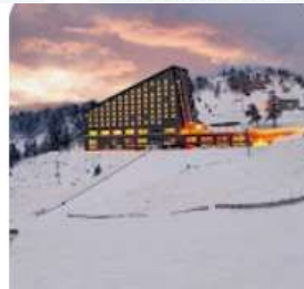
Kartalkaya Kayak Merkezi