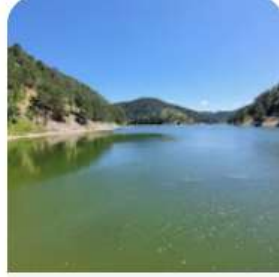
Sünnet Gölü Tabiat Parkı