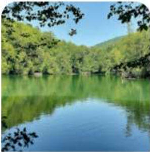
Yedigöller Milli Parkı