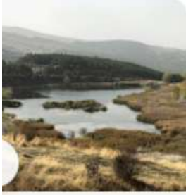
Karagöl Milli Parkı (Tabiat Parkı)